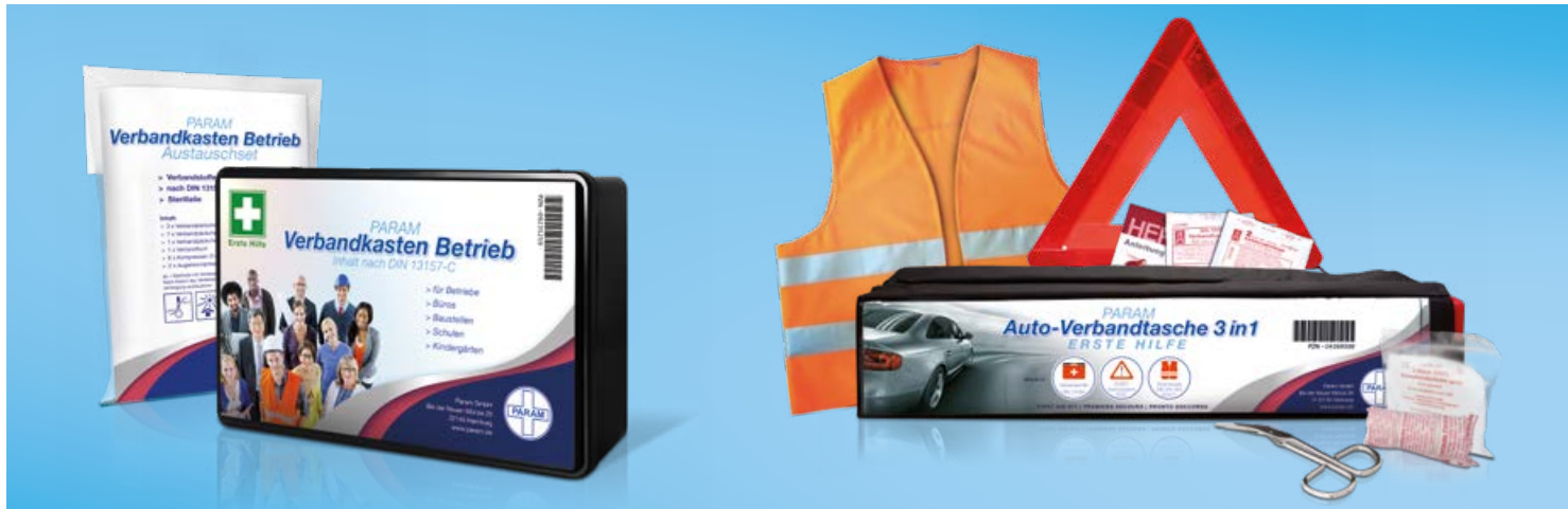
Verbandkasten Betrieb + Austauschset