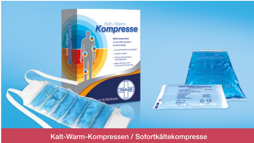
Kalt-Warm-Kompressen / Sofortkältekomresse