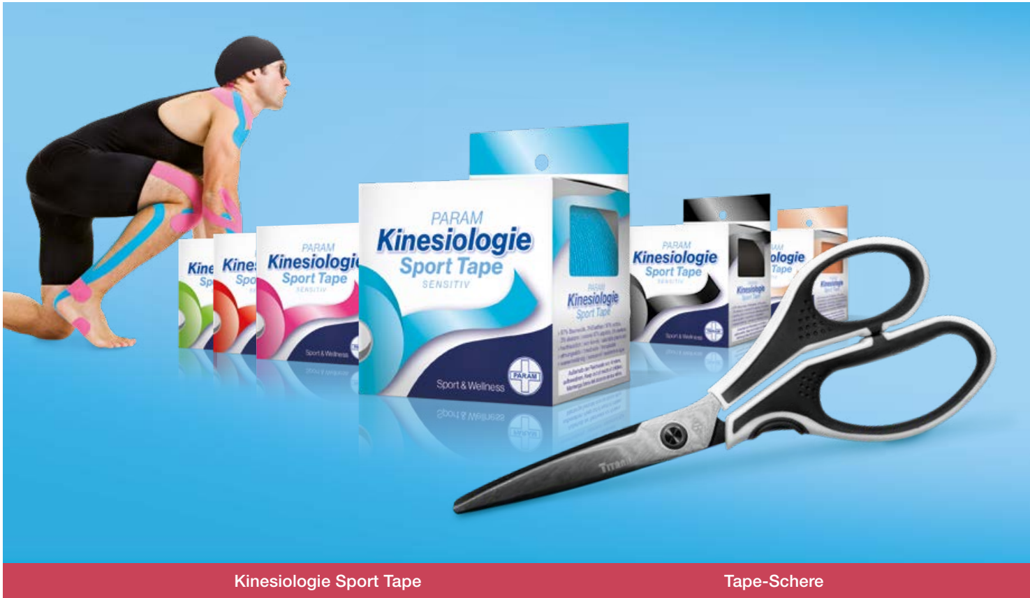
Kinesiologie Sport Tape